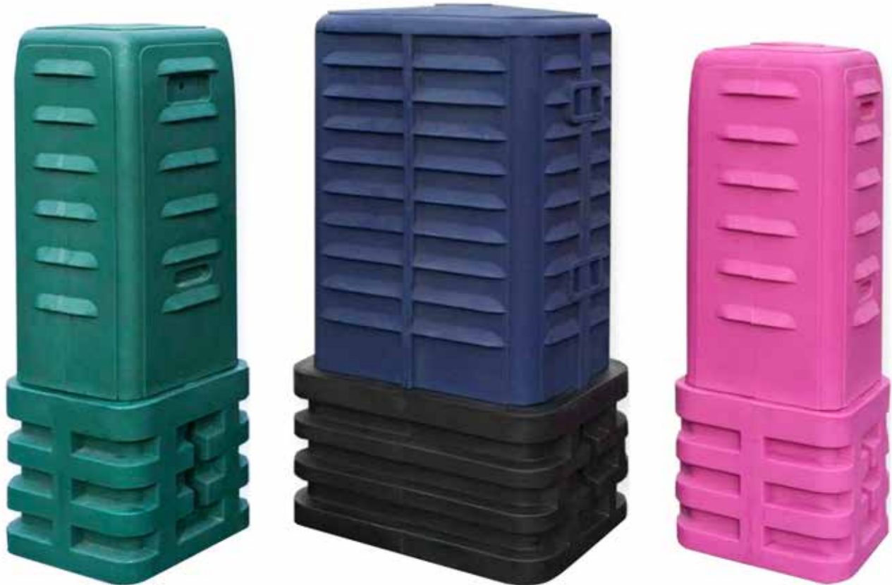
SPH1212 (Verde Oscuro)